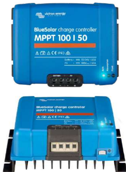
Controlador de carga solar MPPT 100/50